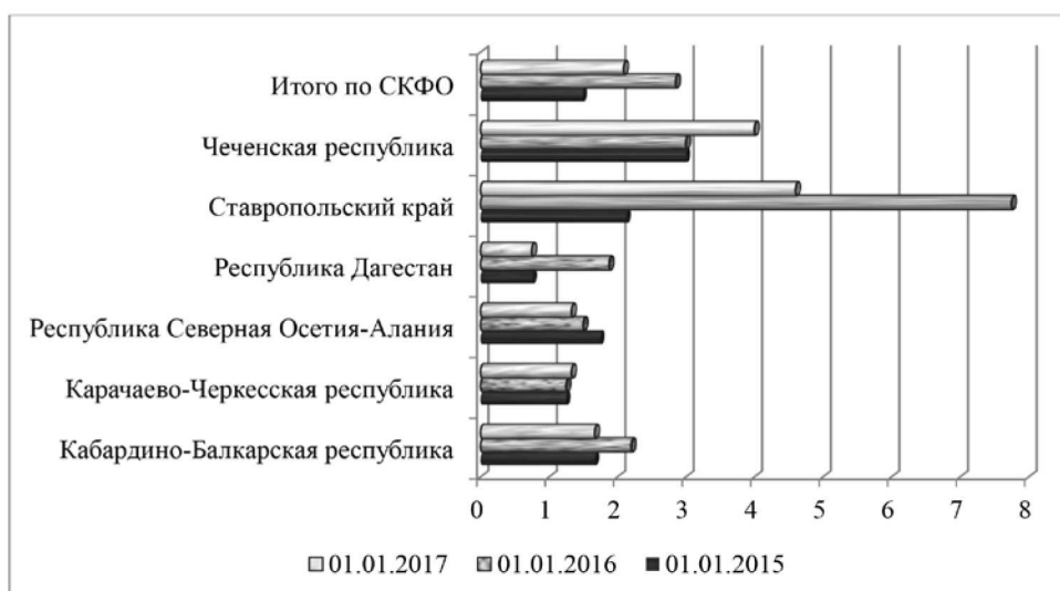
Рис. 2. Динамика репутационного фона банковского сектора субъектов СКФО